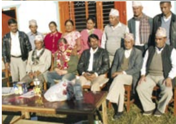
1_ Students singing the national anthem. 2_ Teachers. 3_ View from Tallo Gogan Gaunda. 4_ 2 girls working in the village.

Einige Tage und mehrere Telefonate später tauchte der Projektverantwortliche auf und meinte, ich könnte am nächsten Tag zu meiner, natürlich selbst ausgesuchten, Schule aufbrechen. Da ich noch nie in Nepal war, gab es nicht viel zu überlegen, und ich entschied mich für eine Schule in der Nähe von Pokhara, einem bekannten Touristenort und Trekkinggebiet im Westen Nepals.