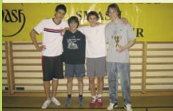
Die Sieger: «Schöggeler», 3c